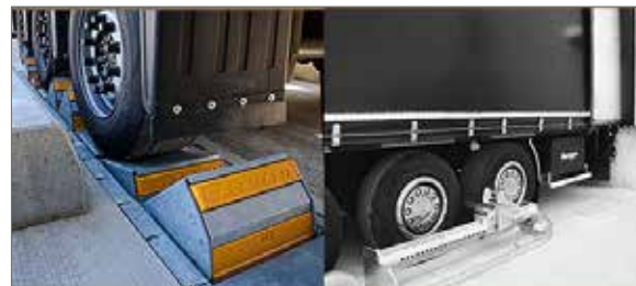
SISTEMI DI SICUREZZA BLOCCA CAMION