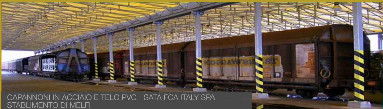
CAPANNONI IN ACCIAIO E TELO PVC - SATA FCA ITALY SPA STABILIMENTO DI MELFI