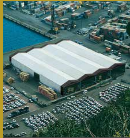
CAPANNONI PER STOCCAGGIO PORTO DI GENOVA