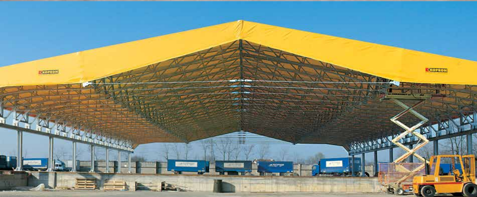
CAPANNONE IN ACCIAIO E TELO PVC MODELLO HANGAR