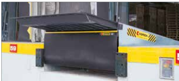
RAMPE DI CARICO