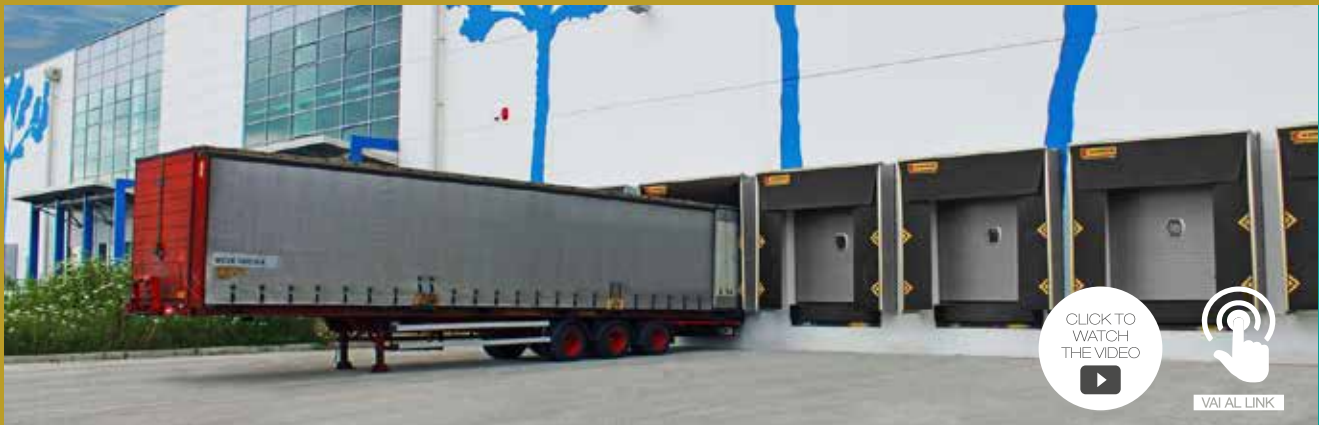
BAIE DI CARICO - CODELFA INTERPORTO DI MORTARA - PAVIA