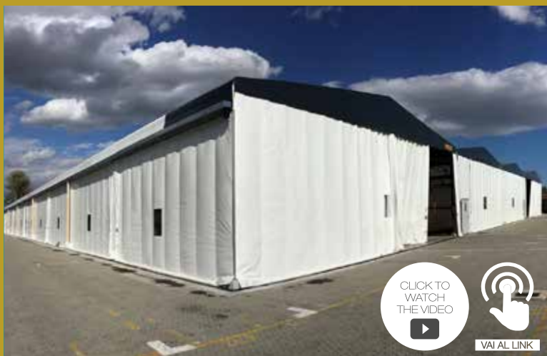
CAPANNONI IN PVC - CLBT INTERPORTO DI BOLOGNA