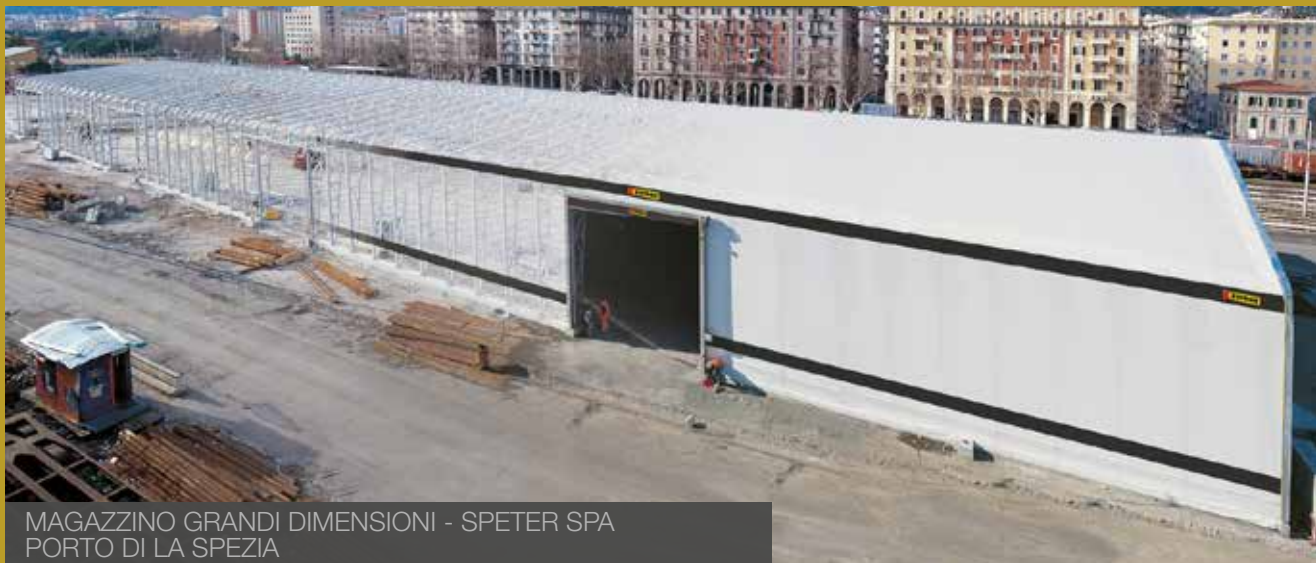
MAGAZZINO GRANDI DIMENSIONI - SPETER SPA PORTO DI LA SPEZIA