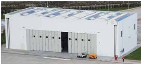
PORTONI A LIBRO