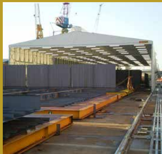
CAPANNONE RETRATTILE - FINCANTIERI PORTO DI MARGHERA