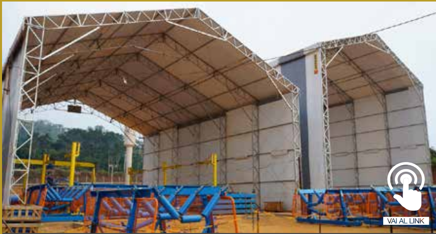
CAPANNONI SU MISURA TECHINT ENGINEERING & CONSTRUCTION - SÃO PAULO - BRASIL