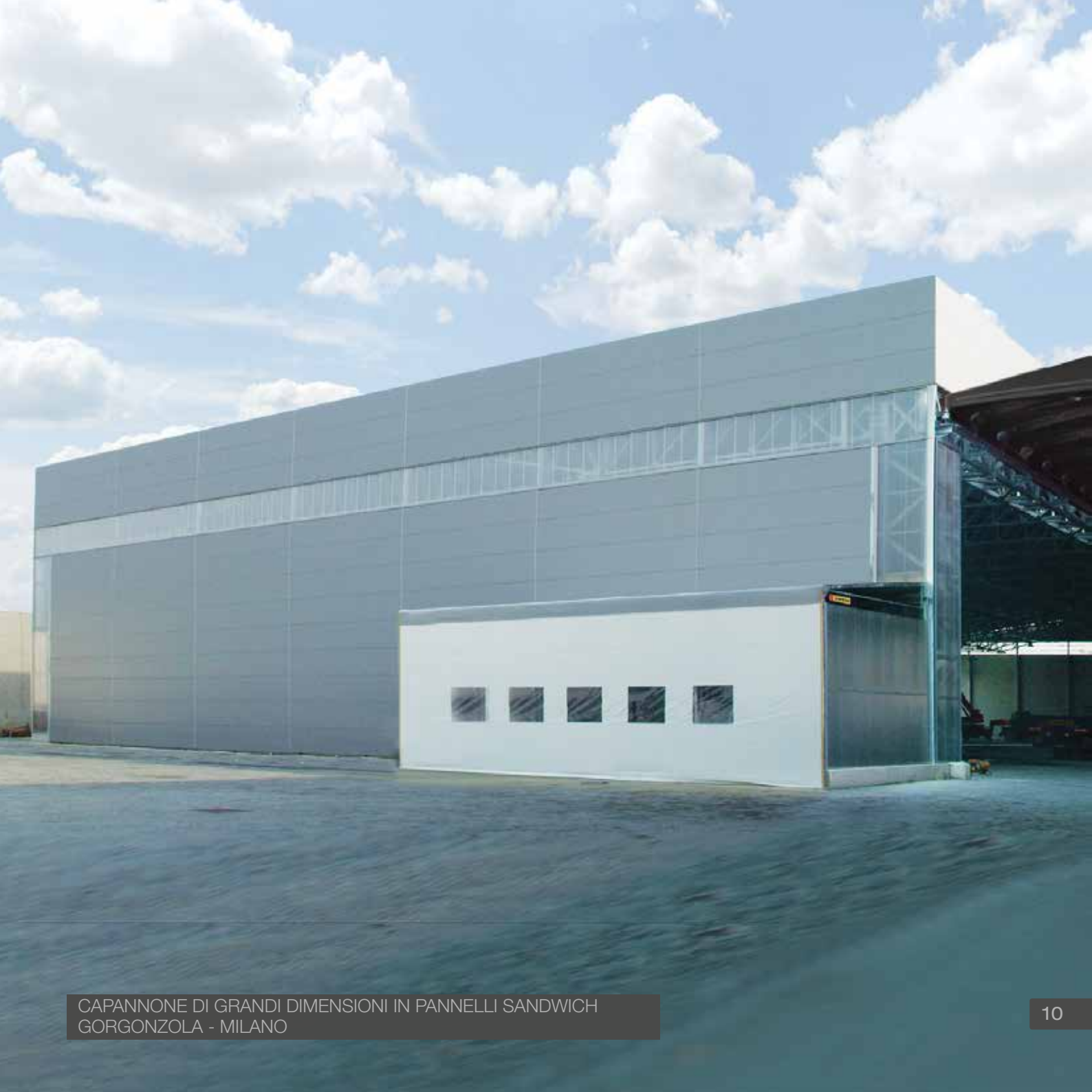
CAPANNONE DI GRANDI DIMENSIONI IN PANNELLI SANDWICH GORGONZOLA - MILANO