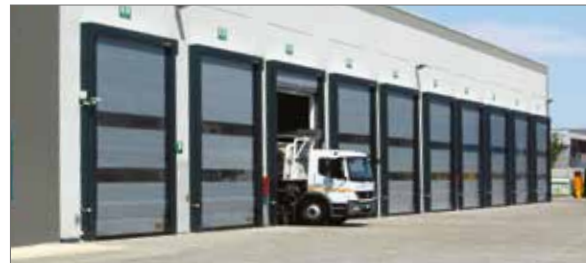
PORTE RAPIDE IN PVC